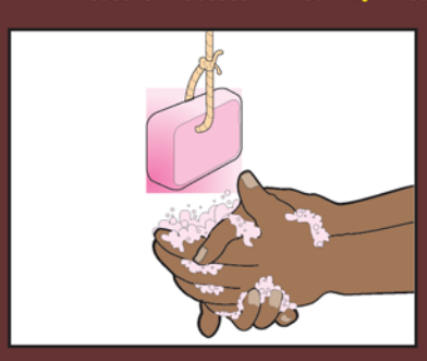
2. በመቀጠል እጀዎን በሞሳ በሳሙና ወይም በአመድ ተቁልቀለይ