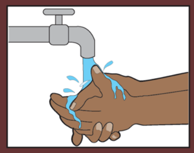
1. በመጀመሪያ እጀዎን በውሃ ያርሱት