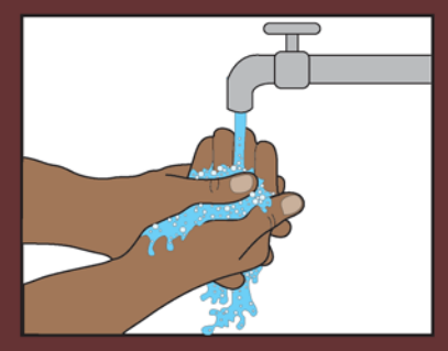
ቆሻሻ እስከሚጠራ ድረስ እጀዎን በሚፈስ ውሃ ይጠቡት